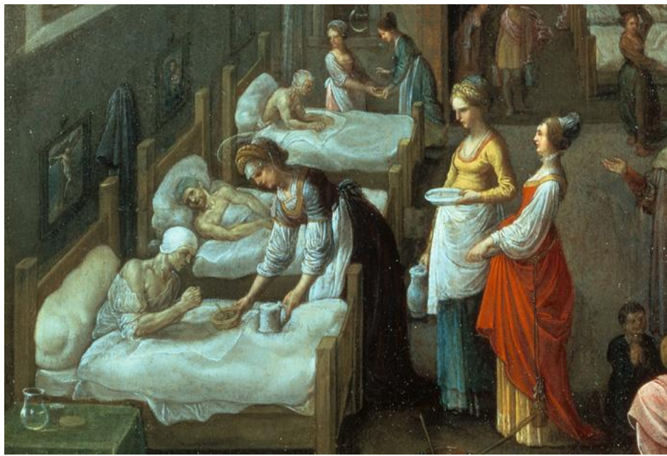
Saint Elizabeth of Hungary bringing food to the inmates of a hospital.