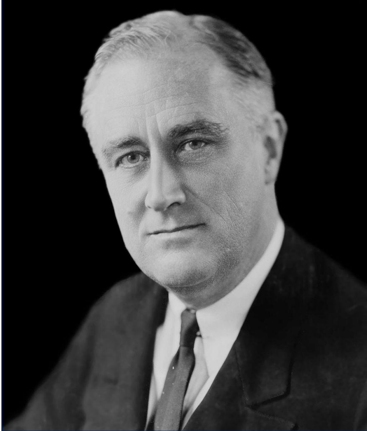
Franklin Delano Roosevelt