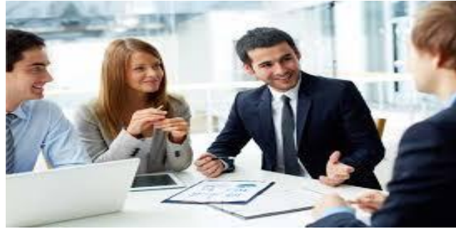
COMMUNICATION By Jeff Christensen (Seattle 1976 - )