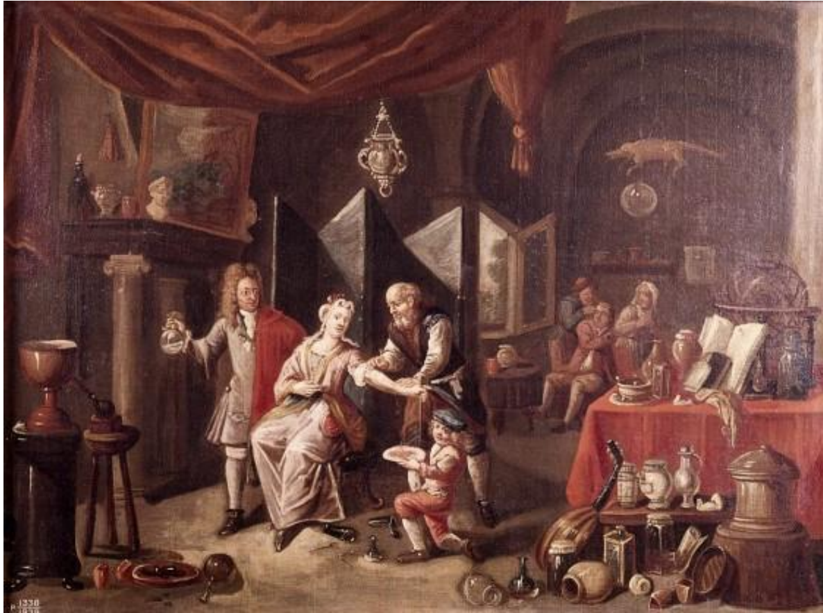
A woman being bled by leeches Early 1700's by an unknown Flemish artist